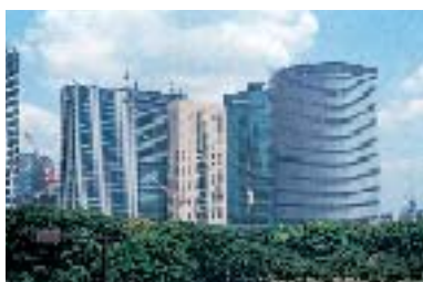
東京港側より望む