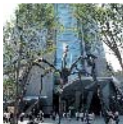
ブロンズ製モニュメント「ママン」