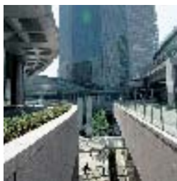
ビルを結ぶペデストリアンデッキ