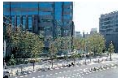
竹林があちこちに配される