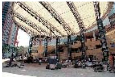
六本木ヒルズアリーナ