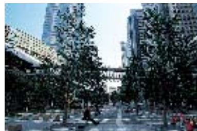
品川セントラルガーデン