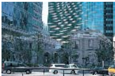
復元された明治時代の「新橋駅」