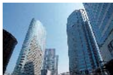
高さを競う超高層ビル群