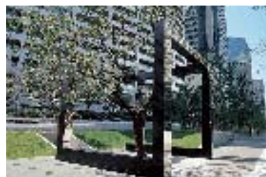
セントラルガーデンに置かれたモニュメント