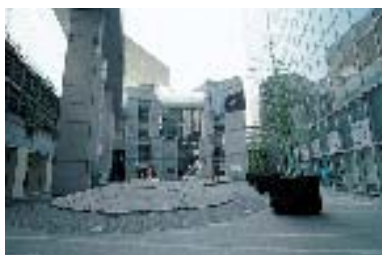
憩いの場「亀の噴水広場」