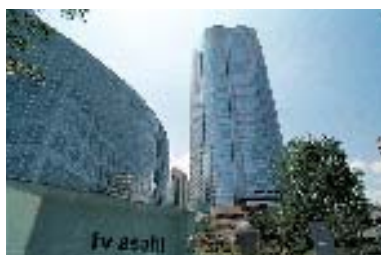
テレビ朝日棟より森タワーを望む