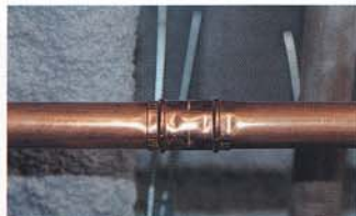
給湯配管に使用された機械式継手