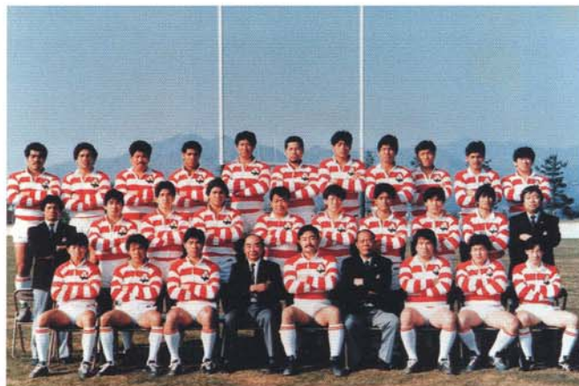
1987年、第1回ワールドカップ日本代表(前列中央)

横井 安全性の立証が必要となりますが、銅がぜひ人類の役に立てればと思います。今日は楽しい話をたくさん聞かせていただいて、興味深い時を過ごさせていただきました。本日はありがとうございました。