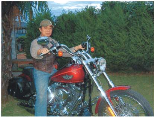
ハーレーと横井専務理事