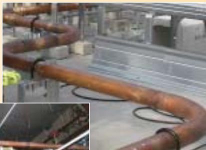
屋上機械ベンダー曲げ加工