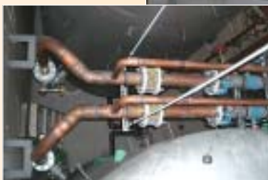
給水管(20A)および還管(40A)接続部