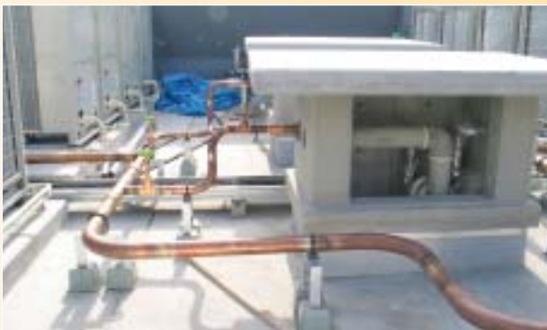
屋上気水分離器にいたる給湯用銅管(主管)

「これまで銅管のろう付けは、狭いスペースで火を使わなければならないため、施工性に問題があると感じていました。しかし、今回の物件では銅管を工場ですべ加工し、接