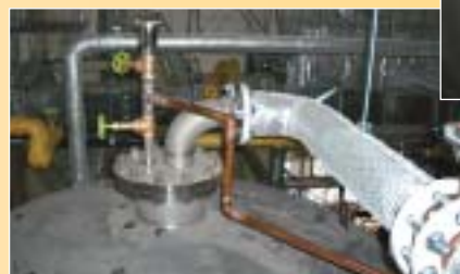
立形貯湯槽に設けた 二重構造の出湯管およびエア抜き管