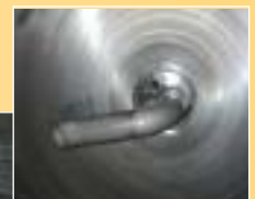
貯湯槽内から見た出湯口 およびエア抜き口