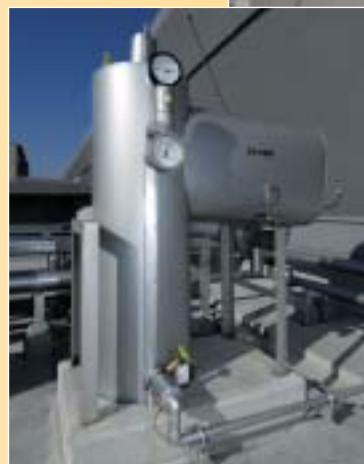
屋上に設置した気水分離器