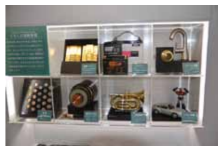
くらしと非鉄金属コーナー