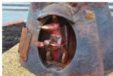
童話に登場するキツネ