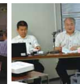
ロードマップ説明会