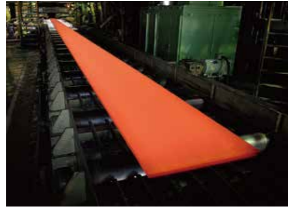
ハイパフォーマンスな熱間圧延機