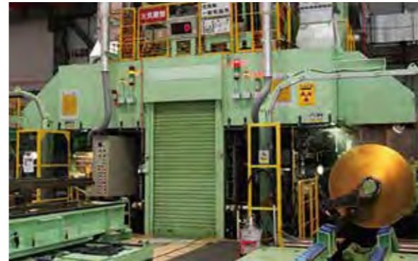
加工範囲の広い冷間圧延機