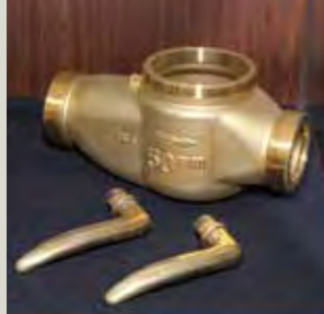
水道メーターなどで需要の高い安心の鉛フリー素材・エコプラス。