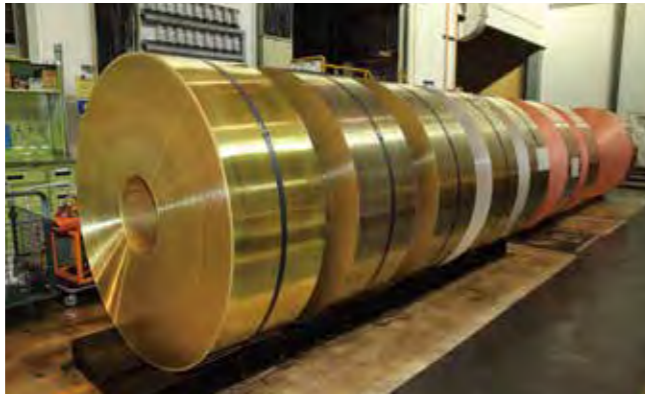
製造過程の条(左から金色に輝く黄銅、銅ニッケル系合金、銅色が鮮やかな純銅)。