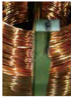
連続伸線や真空焼鈍などの製造過程を経て線製品へ。