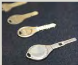
高強度の白色銅合金WNS7は特性と意匠性から自動車、家庭用キーの市場をけん引。