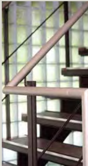
超抗菌性に加え変色もしづらいクリーンプライト。美しいシャンパンゴールドの輝きで病院内の手すりなどに好評。