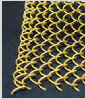
海中で超抗菌性を発揮。藻や貝が網に付着せず作業負担を軽減すると海外から注文も多い養殖生簀用銅合金線UR30ST。