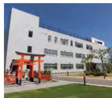
世界遺産に登録された百舌鳥・古市古墳群や千利休で有名な町・堺に、1935年、三宝製作所は開所した。

「工場でも疵ができれば製品になりませんからね。つねに万全の体制で品質を保っています」他にも、ビル8階の高さの規模にしてラインをストップさせない工夫を凝らした連続焼鈍酸洗のAPライン、一度に120トンを超えて熱処理できるベル型焼鈍炉、0.08〜7mmまでの板圧調整ができる圧延機など、スピーディかつ世界に誇る高品質をキ