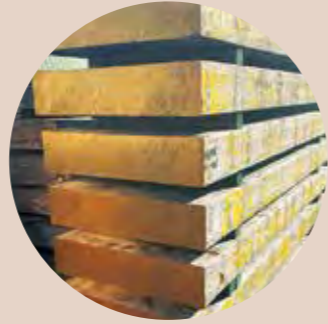
近くの堺工場から届く純銅系インゴットと製作所内の銅合金を合わせると使用量は約1万1,000トン/月に。