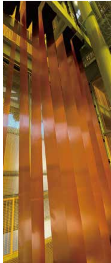
見上げるほど高いAP(連続焼鈍酸洗)ライン

国内外のユーザーの信頼に最高品質で応える日本最大の伸銅メーカー三菱伸銅株式会社。その西の生産拠点が、大阪府堺市の「三宝製作所」である。板・条・棒線などの伸銅品の安定供給を担い、独自の技術研究で自動車産業や建設業、インフラなどの特殊なニーズにマッチした新しい銅合金も次々と開発。銅の可能性を妥協することなく追い求め続けるその姿をクローズアップする。